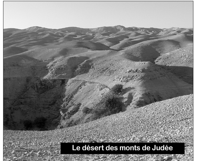
Le désert des monts de Judée